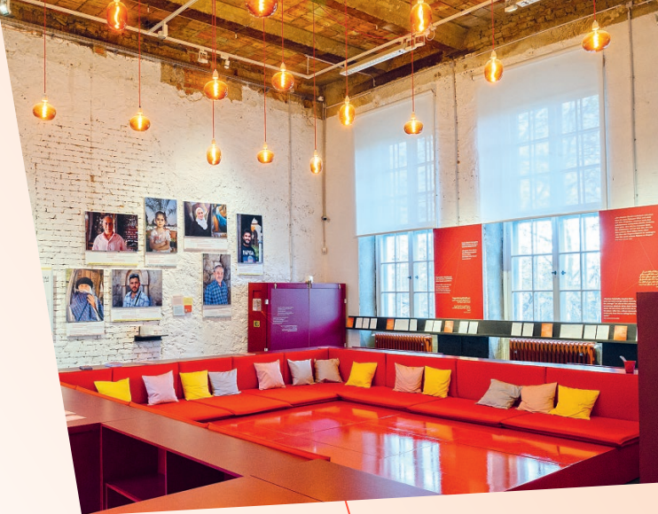
© „WIR“ von Silvana Der-Meguerditchian

Museum für Völkerkunde Dresden Japanisches Palais Palaisplatz 11 01097 Dresden